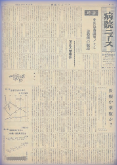
第 1 号（昭和 46 年 4 月 20 日）

平成 29 年 1 月 10 日：題字デザイン、活字サイズ、用紙サイズの一新作業が完了